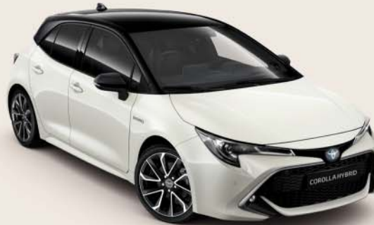
2KR White Pearl * /Night Sky Black §