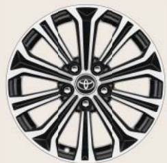
Jantes de 17" en alliage brossé, coloris noir (10 branches)