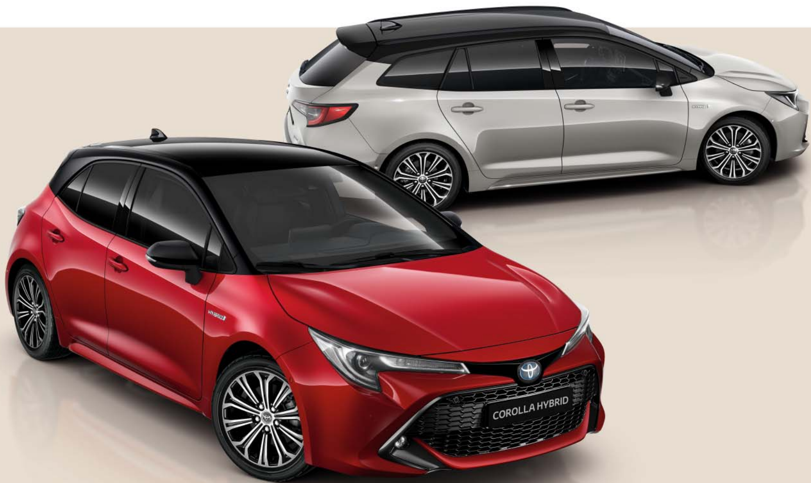
Modèle illustré : Corolla Hybrid Style.