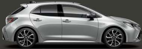
1F7 Ultra Silver §