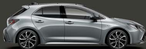
1H5 Cement Grey 5