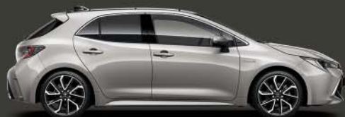
1J6 Precious Silver 5