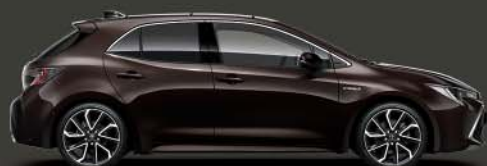
4W9 Phantom Brown 5