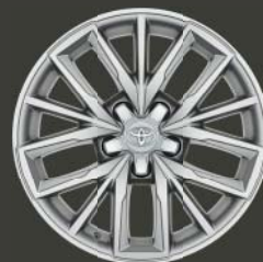
Jantes de 17" en alliage, couleur argent (5 triples branches)