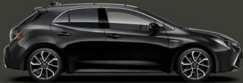
209 Night Sky Black §