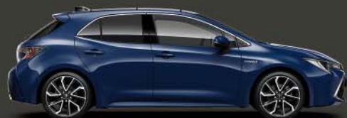
8Q4 Dark Blue 6