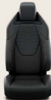
Habillage partiellement en cuir, noir avec surpiqûres rouges et inserts noirs De série sur Premium