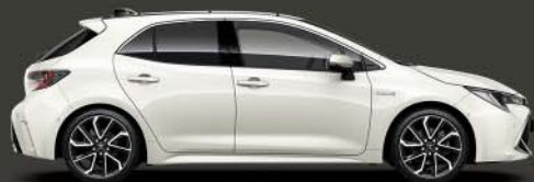
070 White Pearl*