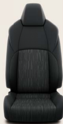
Habillage en tissu, noir De série sur Corolla