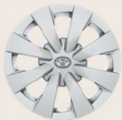
Jantes de 15" en acier avec enjoliveurs (6 doubles branches)