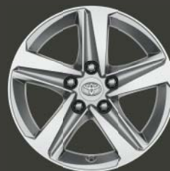
Jantes de 16" en alliage, couleur argent (5 branches)