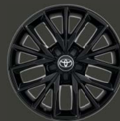
Jantes de 17" en alliage, couleur noir (5 triples branches)