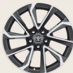
Jantes de 18" en alliage brossé, coloris gris bi-ton (5 doubles branches)