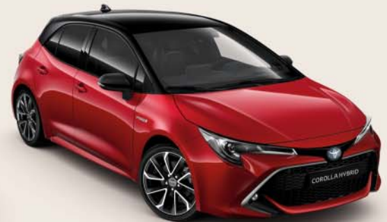
2SZ Emotional Red § /Night Sky Black §