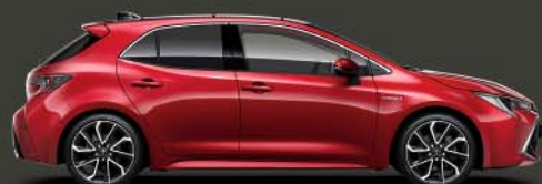
3U5 Emotional Red 5