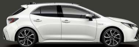
040 Super White