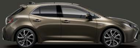
6X1 Oxide Bronze §