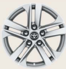
Jantes de 16" en alliage (5 doubles branches)