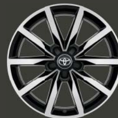
Jantes de 18" en alliage brossé, couleur noir (5 doubles branches)