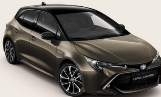
2RF Oxide Bronze § /Night Sky Black §