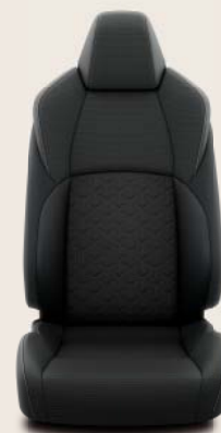
Habillage en tissu à motifs en relief, noir avec surpiqûres grises De série sur Dynamic & Style