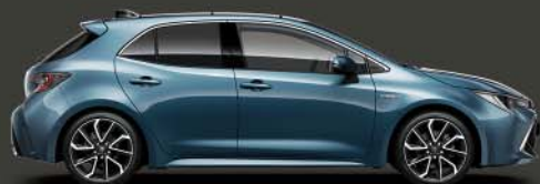
8U6 Denim Blue 5