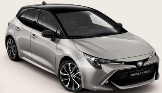
2RD Precious Silver § /Night Sky Black §